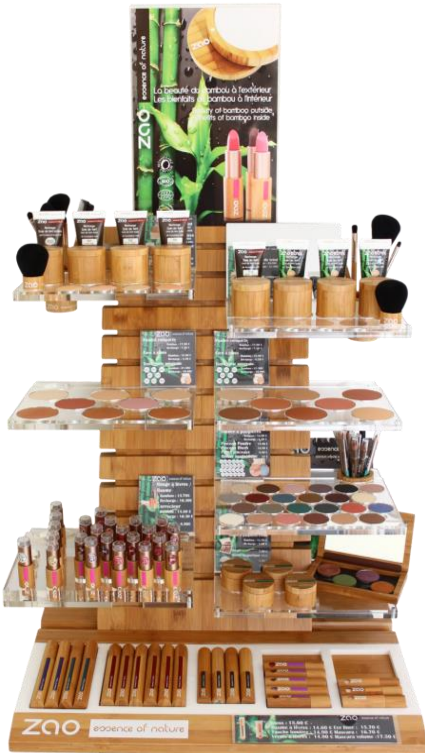
IMAGEN DE MARCA